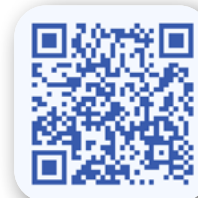
La validation des acquis de l'expérience (VAE)