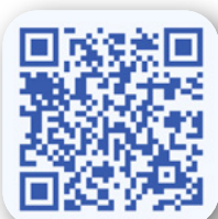
La trame de l'entretien professionnel